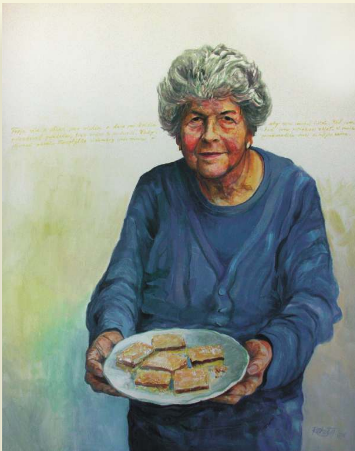
Rudolf Rabatin, Mamkine koláče, 2016, akryl na plátne, 120 x 95 cm

Výstavu Interferencie venujeme pamiatke našich rodičov, ktorí nám svojím príkladom a výchovou zanechali vzácne bohatstvo - kreativitu, pracovitost a vzájomnú lásku.