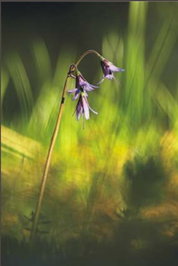
Pavol Rabatin, Zvon eky vo vetre, 2015