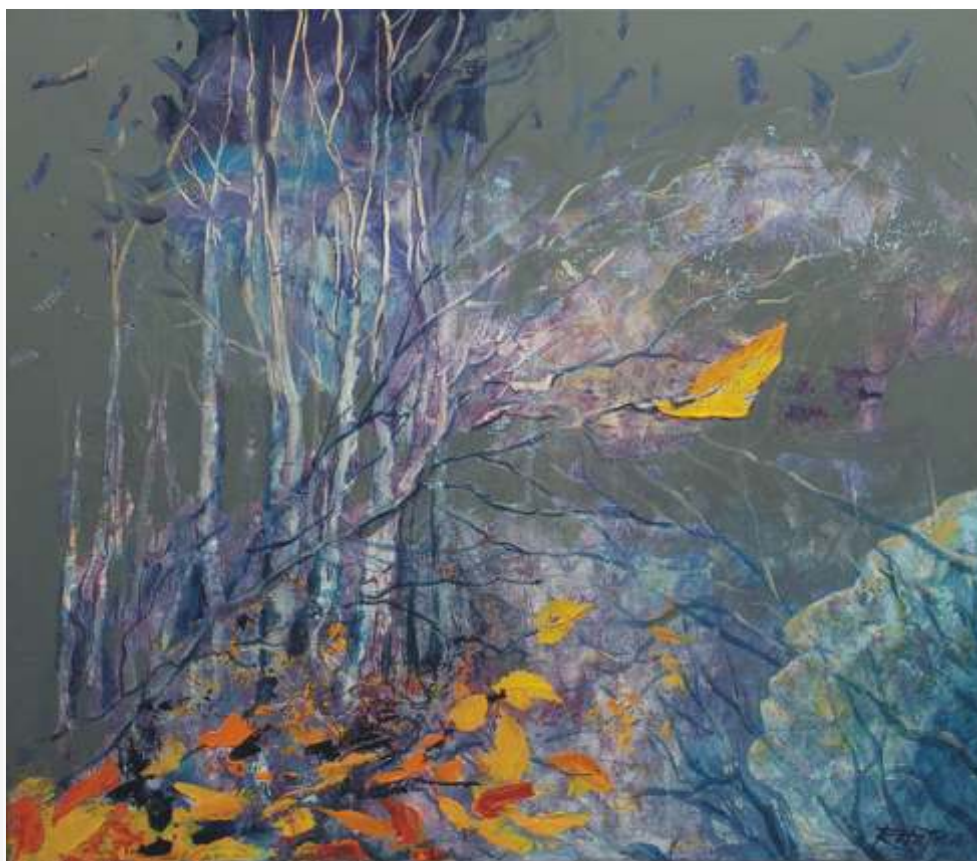
Rudolf Rabatin, Posledný list (venovaný pamiatke otca), 2008, akryl na plátne, 70 x 80 cm