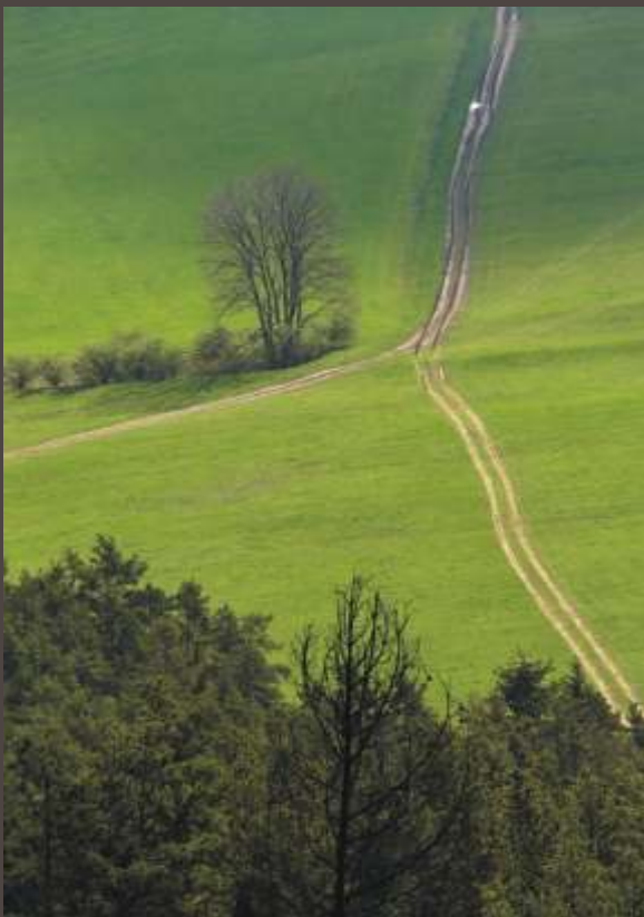
Pavol Rabatin, Ypsilon, 2019