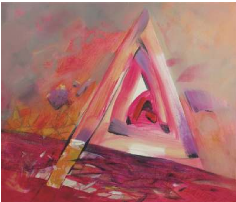
Rudolf Rabatin, Výtvarný moment, 2015, akryl, 60 x 70 cm